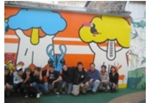
Fresque réalisée pour une crèche.